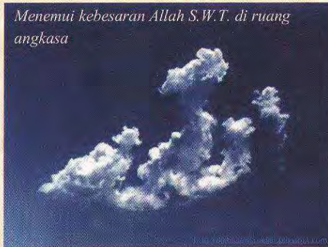
Menemui kebesaran Allah S.W.T. di ruang angkasa

“ ..al-Quran mengawasi perkembangan pengetahuan manusia bahkan sentiasa ada penemuan baru selagi mana manusia berusaha membongkar isi kandungannya.