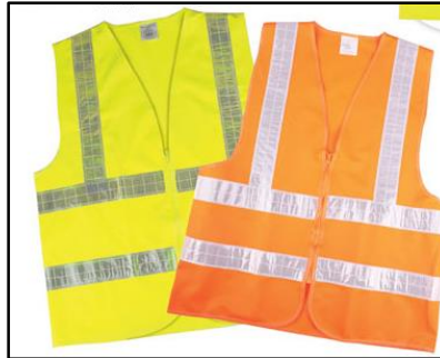
Rajah 1.3: Contoh Ves Keselamatan