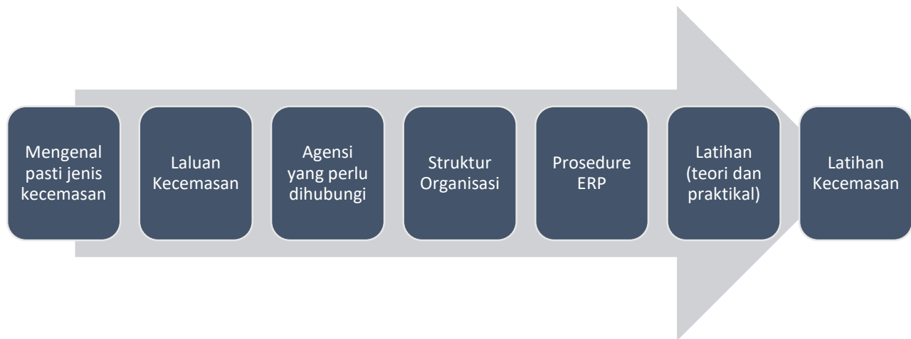
Rajah 1.1: Panduan Membangunkan Pelan Tindakan Kecemasan (ERP)

Perancangan untuk mewujudkan ERP di tempat kerja perlu melibatkan elemen seperti di Rajah 1.1 di bawah.