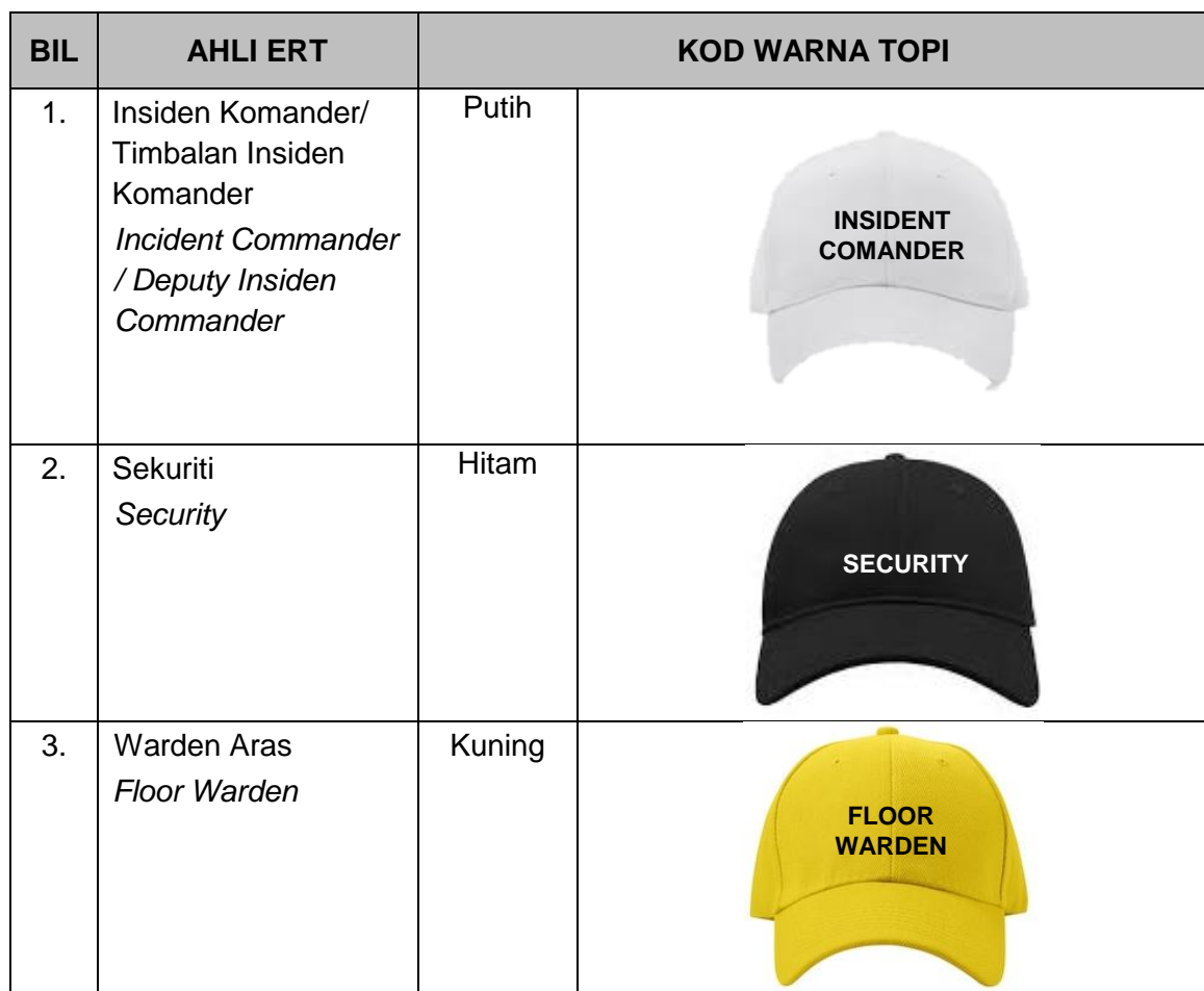
Jadual 1.2: Pengenalan Kod Warna Topi Ahli ERT

Setiap ahli Pasukan Tindakan Kecemasan (ERT) adalah dikehendaki untuk memakai tanda nama, topi dan ves keselamatan sebagai pengenalan diri sewaktu menjalankan tugas semasa berhadapan dalam situasi kecemasan. Jadual 1.2 menerangkan maksud setiap warna topi pengenalan diri mengikut tempat masing-masing. Rajah 1.3 adalah contoh ves keselamatan yang perlu dipakai untuk bertugas semasa kecemasan.